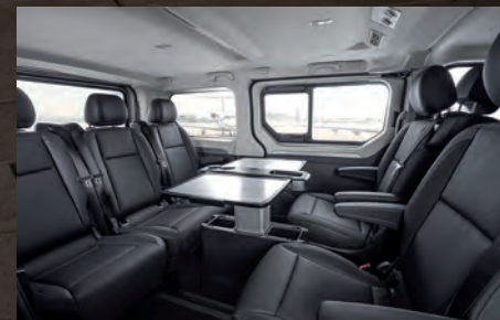
Sitzkonfigurationen des neuen Opel Tourer